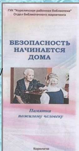
Безопасность начинается дома : информационный буклет сост. М.И. Ровдан. – Кореличи, 2022. – 1 л.