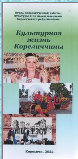
Культурная жизнь Кореличчины : информационный буклет / сост. Е.В. Лисовская. – Кореличи, 2022. – 3 л.