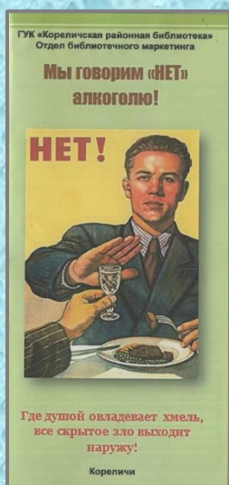
Здоровый образ жизни : информационный буклет / сост. М.И.Ровдан, Е.В. Лисовская – Кореличи, 2022. – 1 л.