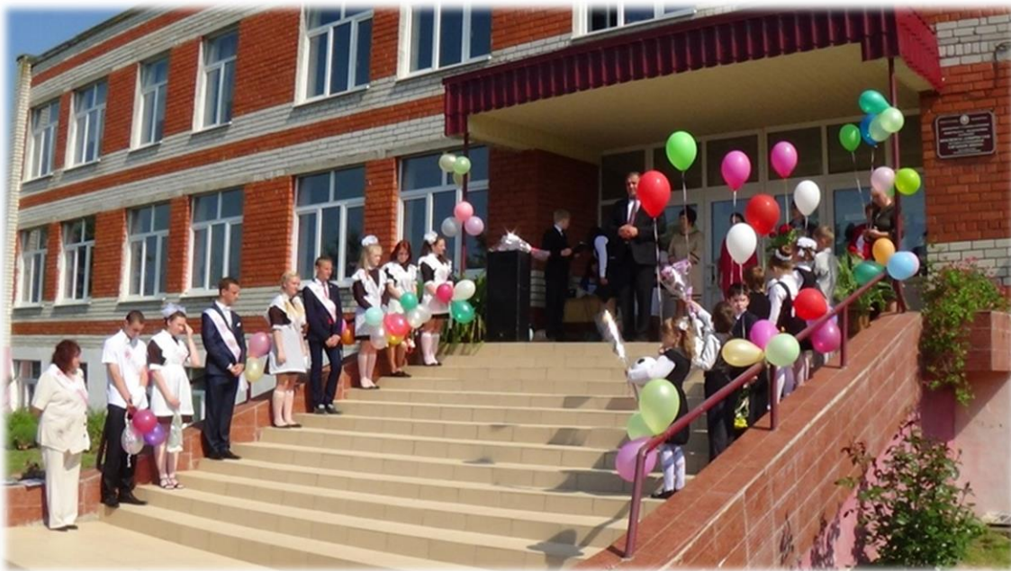
Педагагічны комплекс “Дзіцячы сад-школа” у аграгарадку Краснае

На сённяшні дзень у рэгіёне паспяхова развіваецца інфраструктура і падтрымліваюцца сацыяльныя стандарты, што забяспечвае надзейнасць у жыццядзейнасці мясцовага насельніцтва.