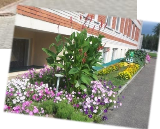
Красненскі Дом культуры, адміністрацыйны будынак Красненскага сельскага Савета і сельскагаспадарчага вытворчага кааператыва "Маяк-Заполле"