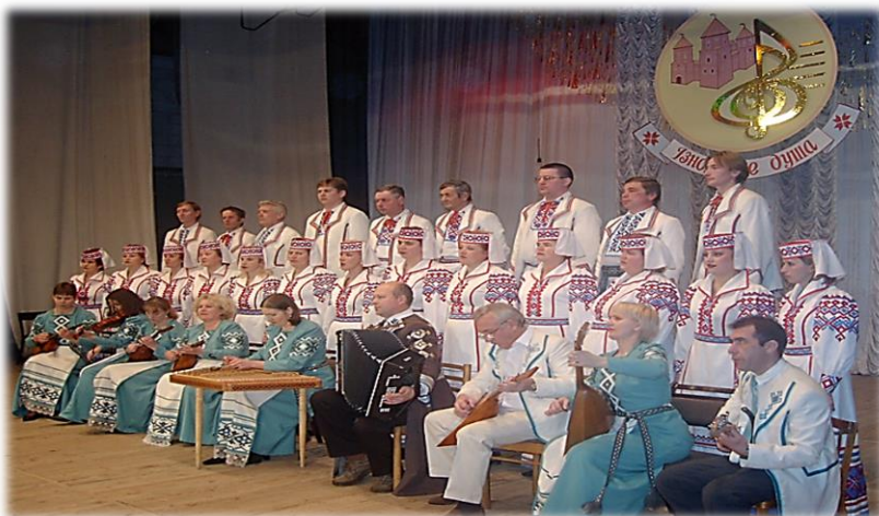
Народны хор Красненскага сельскага Дома культуры

"Маяк", атрымаўшы гэта званне ў 1976 годзе. На сённяшні дзень гэта народны хор народнай песні Аддзела культуры і вольнага часу "Красненскі Дом культуры". У складзе калектыву хору выступаў знакаміты за межамі нашай Радзімы вакальны ансамбль "Монічы", а ў 1989 годзе з саставу Запольскага хору выдзеліўся гурт народнай музыкі і песні "Забава", атрымаўшы ў 1996 годзе званне народнага.