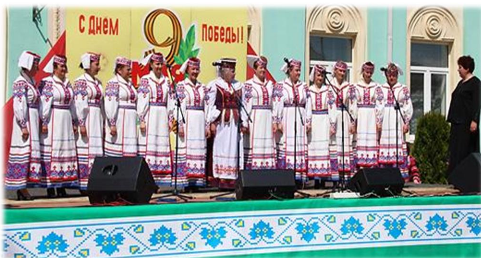
Жаночая вакальная група народнага хора Красненскага СДК