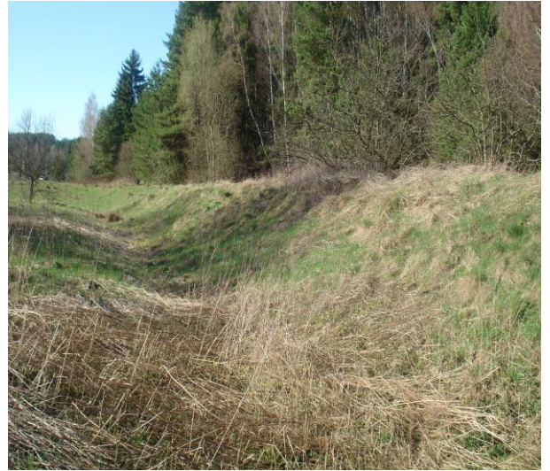
Участак вузкакалейнай жалезнай дарогі перад вёскай Забердава 2016 год.