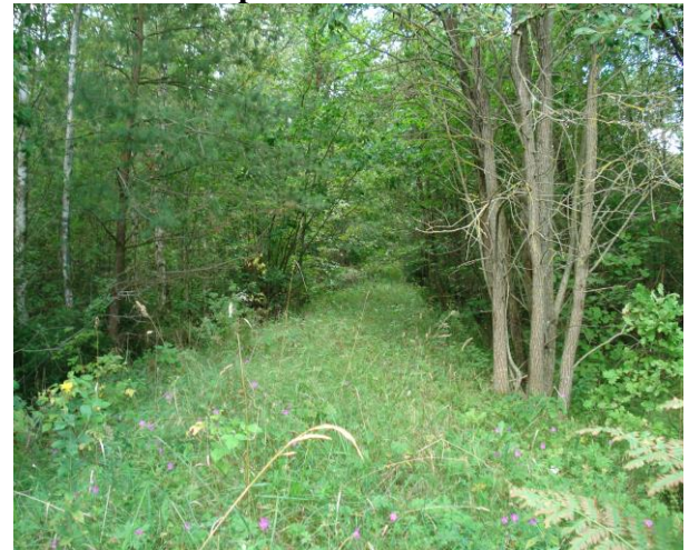
Участак вузвакалейнай жалезнай дарогі каля вёскі Караліны 2016 год.

Заўвага: запісана з успамінаў састарэлых жыхароў раёна ў 80-90 гады ХХ стагоддзя.