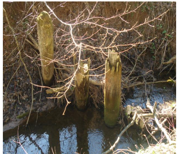
Палі маставыя вузкакалейкі праз раку Земчатку 2016 год.