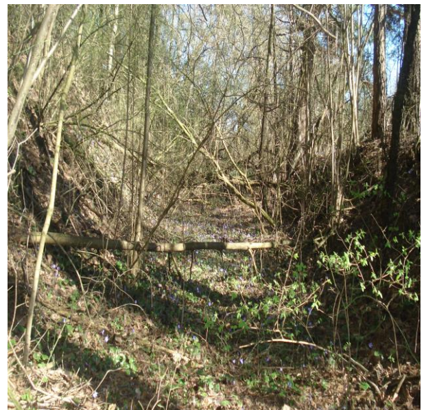
Участак жалезнай дарогі паміж вёскамі Скрышава - Забердава 2016 год.