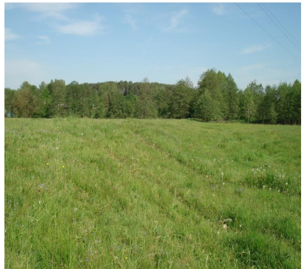
Участак вузкакалейнай дарогі паміж вёскамі Забердава – Русацін 2016 год.