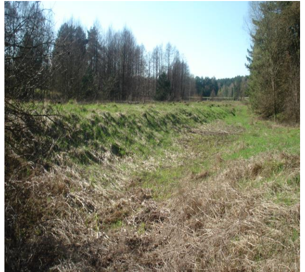
Участак вузкакалейнай жалезнай дарогі каля вёскі Забердава 2016 год.