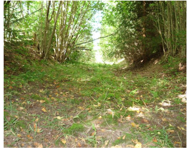
Участак вузвакалейнай дарогі паміж вёскамі Сёгда – Караліны 2016 год.