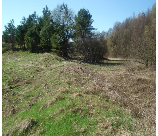
Участак вузкакалейнай жалезнай дарогі каля вёскі Скрышава 2016 год.