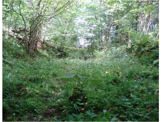
Участак вузвакалейнай жалезнай дарогі каля вёскі Сёгда 2016 год.